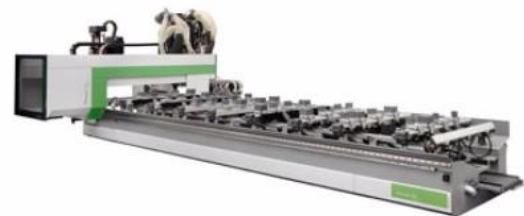
Rover B Edge CNC trebearbeidingscenter se på video