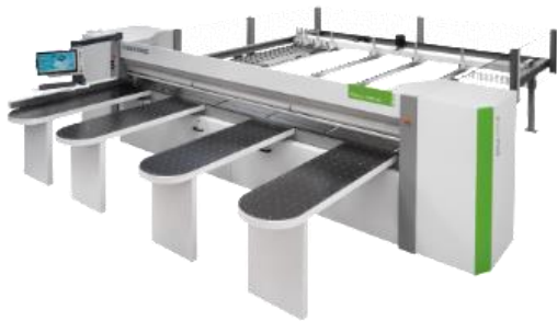
Selco - X Feeder L Automatisk lastning + etiketteringssystem se på video

Rover B edge 1967 med Synchro Rover B FT 2231 i Winstore 3D K3 cell Insider M + Robot Nextstep + Winstore 3D K1 Stream B mds 2.0 autom. + Winner W2 Stream A + Winner W4 Selco WN 6 med X-Feeder + Winner W4