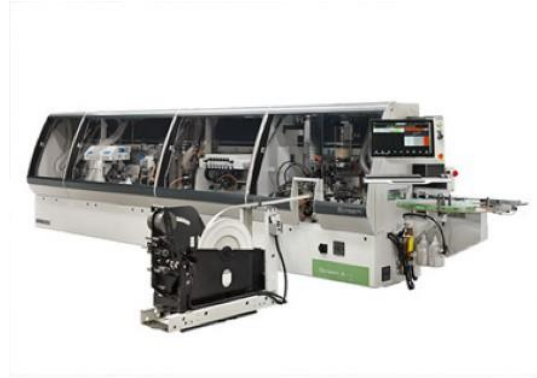
Biesse STREAM A+WINNER W4 Automatisk kantlisting se på video