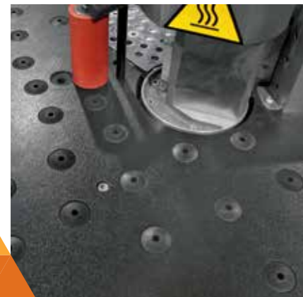
Phenolic working table Arbeitstisch aus synthetischer Faser mit Phenolharz

Flexibility and easy use: Casadei manual edgebander for straight and shaped panels. Flexibilität und einfache Benutzung; Manuelle Kantenanleimmaschine Casadei für gerade und geformte Platten.