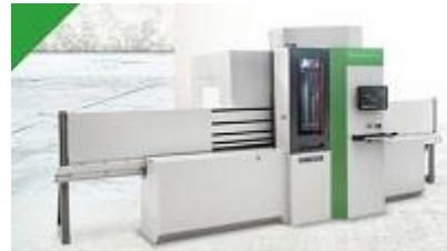
Biesse Brema Eko 2.2