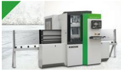
Biesse Brema Eko 2.1

Her følger flere vertikale CNC maskinene fra Biesse sitt sortiment. Klikk på bildene for mer info.