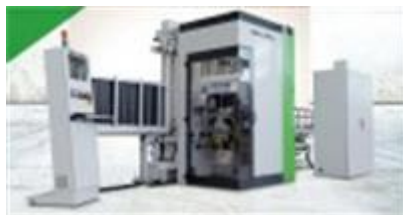
Biesse Brema Vektor 15