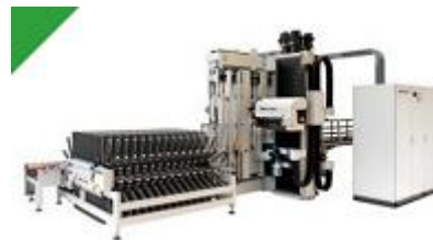
Biesse Brema Vektor 25

En vertikal bormaskin og en platesag er kanskje det du trenger?