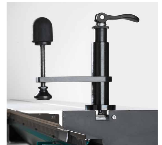
Für alle gängigen Formatkreissägen verwendbar – Nutensteine fixieren die Spannzylinder

Die Komfortvariante Set 2 (oben rechts) enthält zusätzlich zur Standardausrüstung zwei „Hilfsanschläge schmal“ und einen zweiten Schwenkspanner zur Werkstückklemmung.