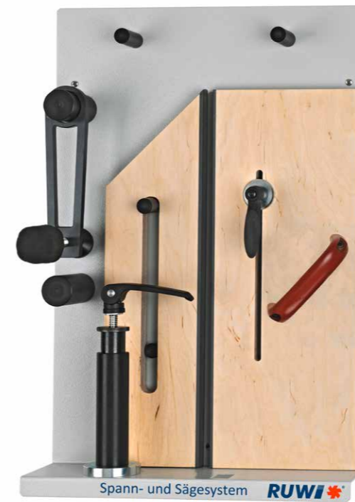
Ordnungspaneel Set Standard