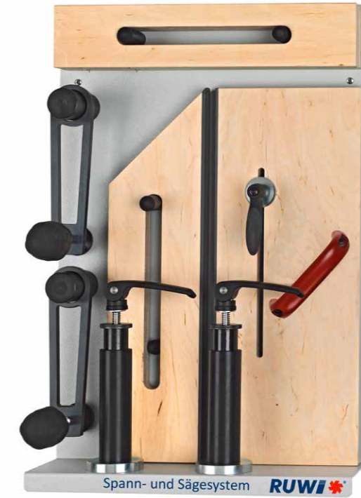
Ordnungspaneel Set Komfort